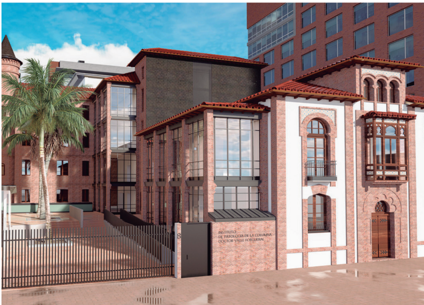
La inauguración del Instituto de Patología de Columna Compleja está prevista para octubre de 2025.